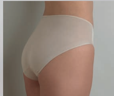
CU-A104 - Bikinislip - S-2XL (38-46)