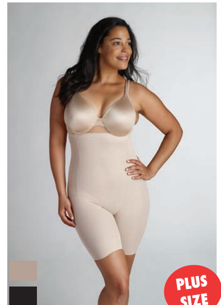
CU-0775 (S - 2XL / 38 - 46) CU-7775 (1X - 5X / 48 - 56) Hoher Slip