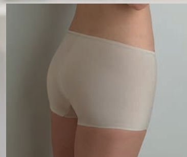
CU-A106 - Panty - S-XL (38-44)