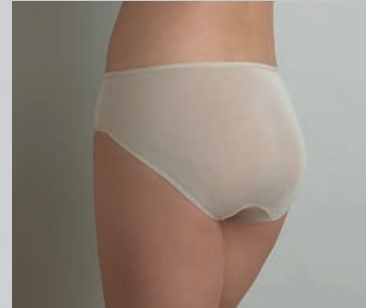
CU-A103 - Hüftslip - S-XL (38-44)