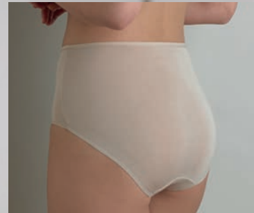
CU-A105 - Slip - S-2XL (38-46)